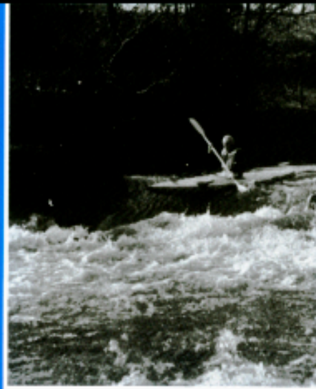
Le barrage de Crinai

Le RAPPEL est un tourbillon sous le barrage; s'il est fort, il est pratiquement impossible d'en sortir lorsqu'on y est pris. « RAPPEL = DANGER MORTEL ». Pour s'assurer si un barrage rappelle, on jette une grosse branche au-dessus et on observe si elle sort du tourbillon. Dans le doute, abstiens-toi.